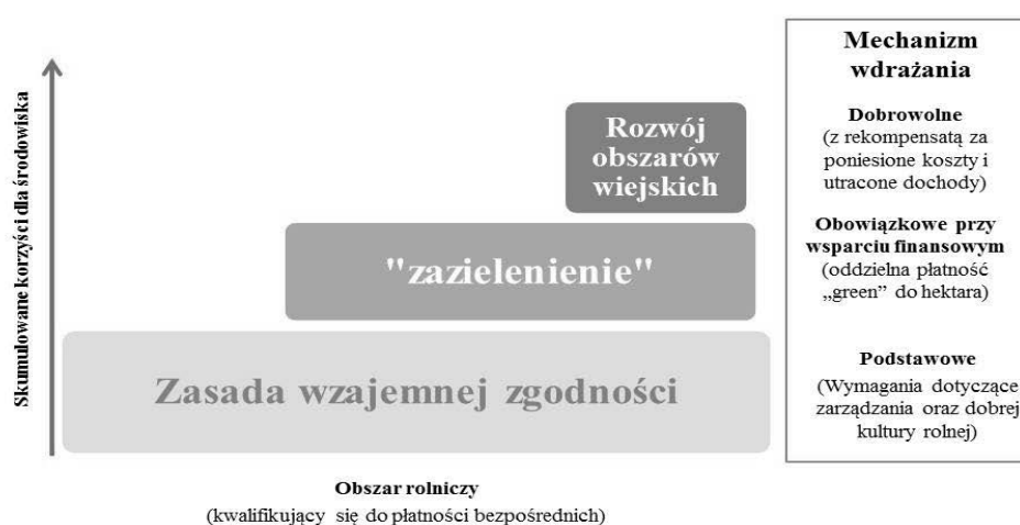
Rys. 2. Struktura nowej "zazielenionej" WPR

finansowa. Państwo stosuje zatem instrumenty ekonomiczne w postaci dotacji za dostarczanie dóbr publicznych oraz w postaci podatków i opłat za niewłaściwą postawę wobec środowiska. Otrzymywana dotacja za dostarczanie dóbr publicznych ma za zadanie rekompensować część kosztów związanych z koniecznością rezygnacji z większego zysku. Na tej podstawie od 2015 r. wprowadzono nowy obowiązkowy mechanizm – tzw. zazielenioną płatność bezpośrednią (I filar). Na tę płatność przeznaczono aż 30% koperty krajowej. Jest to płatność z tytułu realizacji praktyk rolniczych korzystnych dla klimatu i środowiska, którą można uzyskać po spełnieniu określonych wymagań dotyczących dywersyfikacji upraw rolnych, utrzymania TUZ oraz dzięki przeznaczaniu części powierzchni na cele proekologiczne.