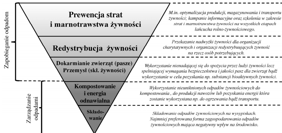
Rys. 4. Zarządzanie stratami i marnotrawstwem żywności

zarządzanie powstających SMŻ, dwa pierwsze priorytety czyli (1) prewencja strat i marnotrawstwa żywności oraz (2) redystrybucja żywności, mogą wpływać w dużym stopniu na bezpieczeństwo żywnościowe (rys. 4).