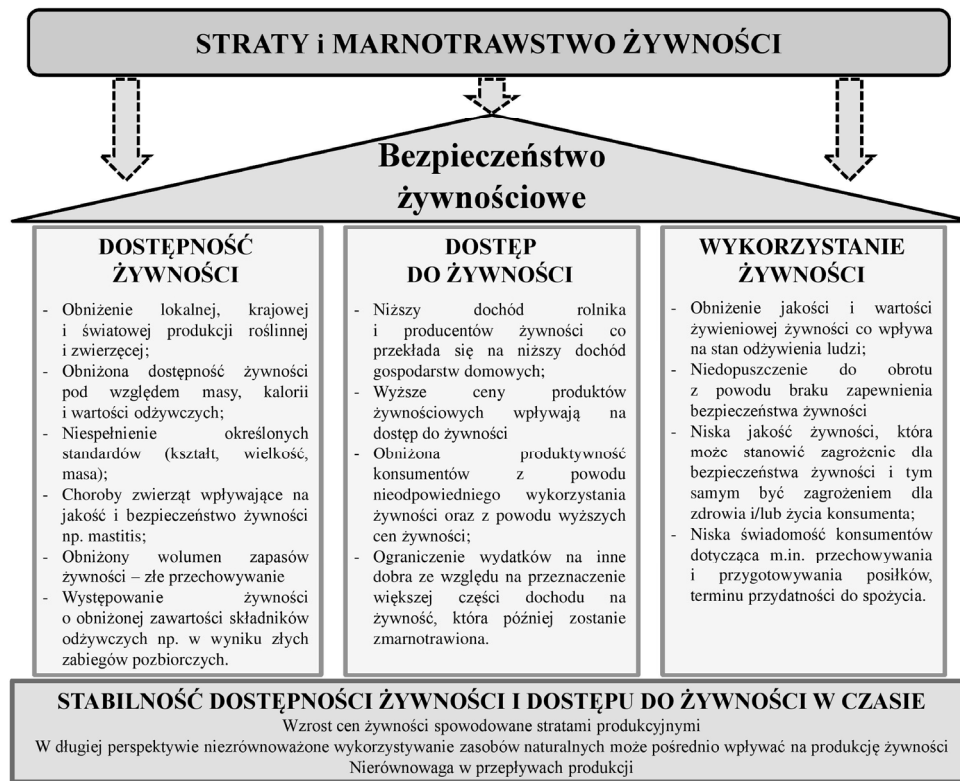
Rys. 3. Wpływ strat i marnotrawstwa żywności na filary bezpieczeństwa żywnościowego

dostęp do żywności w czasie (rys.3). Skutki te mogą być rozpatrywane z perspektywy skutków ekonomicznych, środowiskowych, społecznych bądź zdrowotnych i dotyczyć skali mikro (gospodarstwa domowego, producenta), mezo (łańcucha rolno-żywnościowego) lub makro (kraj, dana społeczność) (Lipinski i in., 2013; Tielens, Candel, 2014; HLPE, 2014). Występowanie marnotrawstwa jest bardziej rozumiane, jako symptom ogólnie zamożniejszych i zabezpieczonych w żywność środowisk, które wykazują nadwyżkę zasobów żywności (EIU, 2014). Dlatego też na bezpieczeństwo żywnościowe większy wpływ będą miały generowane straty żywnościowe. Straty i marnotrawstwo mogą mieć wpływ na zmniejszenie wolumenu wyprodukowanych surowców rolnych, a także produktów przetwórstwa, co może wpływać na zmniejszenie się światowej bądź krajowej dostępności żywności czyli pierwszy filar bezpieczeństwa żywnościowego. Szacuje się, że gdyby zmniejszono o ¼ ilość generowanych SMŻ pod względem tonażu to można by wyżywić dodatkowo ponad 870 mln osób, czyli o wiele więcej niż liczba osób cierpiących z powodu niedożywienia pod względem energetycznym (FAO, 2017a).