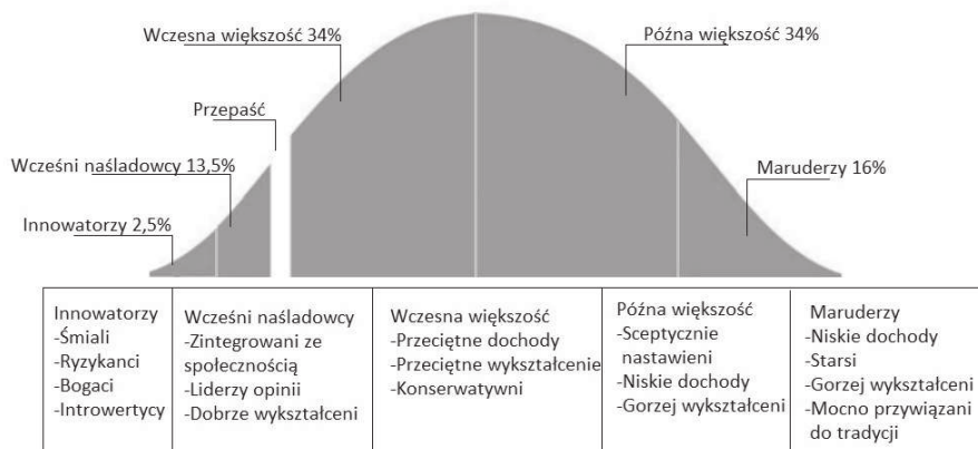
Rys. 2. Model dyfuzji innowacji E.M. Rogersa