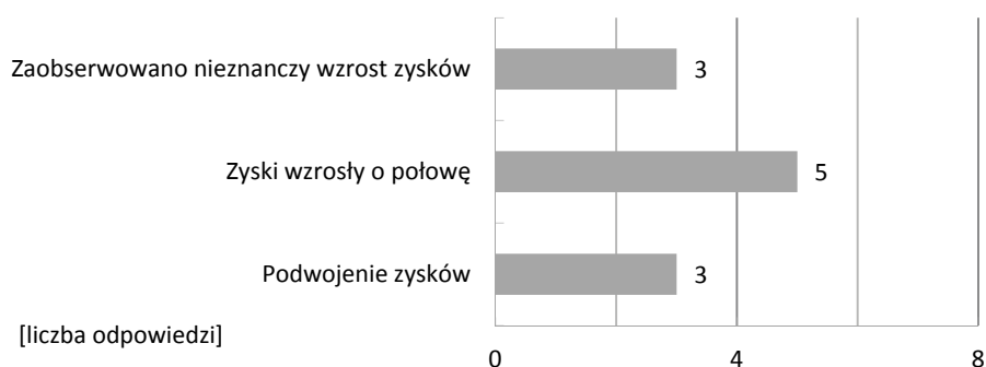
Wykres 3. Deklarowany wzrost zysków po zastosowaniu narzędzi promocji internetowej dla wybranych gospodarstw agroturystycznych w powiecie sokólskim według respondentów

Deklarowany wzrost zysków, jako wyniki promocji internetowej, zaprezentowano na wykresie 3.