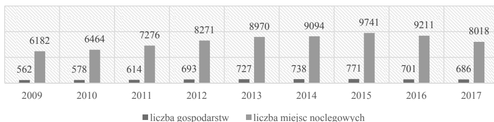
Rysunek 1. Liczba gospodarstw agroturystycznych i miejsc noclegowych w Wielkopolsce w latach 2009-2017

Wobec powyższego podjęto próbę sprawdzenia, czy właściciele gospodarstw agroturystycznych w Wielkopolsce wykorzystują marketing i skąd czerpią środki finansowe na realizację tego typu działań.