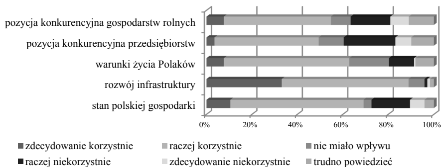
Rys. 3. Opinie respondentów dotyczące oceny wpływu integracji z UE na poszczególne obszary życia społeczno-gospodarczego w Polsce

Jak wynika z badań CBOS w 2016 roku zdecydowana większość Polaków (81%) popiera członkostwo naszego kraju w Unii Europejskiej. Sprzeciw wyraża co dziesiąty (10%) (Komunikat..., 2016). Na tym tle uzyskane wyniki są dość niepokojące, zwłaszcza w kontekście prowadzonej polityki UE wobec młodych rolników. Chodzi tu o obserwowany wśród młodych ludzi wzrost postaw roszczeniowych i niechęć wobec Unii Europejskiej. Warto jednocześnie podkreślić, że blisko 70% respondentów pozytywnie oceniło wpływ naszego członkostwa w UE na rozwój gospodarki, a blisko 90% wyraziło pozytywną ocenę w odniesieniu do poziomu rozwoju infrastruktury. W opinii ponad 60% respondentów, integracja z UE wpłynęła korzystnie na poprawę warunków życia Polaków, blisko 55% wyraziło taką opinię w odniesieniu do wpływu UE na poprawę pozycji konkurencyjnej polskich gospodarstw rolnych, a blisko 50% również na poprawę konkurencyjności polskich przedsiębiorstw (rys. 3).