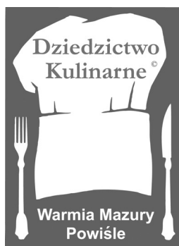
Rys. 3. Logo Europejskiej Sieci Dziedzictwa Kulinarne Warmii, Mazur i Powiśla Fig. 2. European Cuisine Heritage Network logo for region Warmia, Mazury and Powiśle

Dzięki wprowadzeniu etykiety produkty tradycyjne i regionalne przestają być anonimowe. Zwiększa się w ten sposób ich rozpoznawalność, co powinno wpłynąć na wzrost konsumpcji co w konsekwencji doprowadzi do zwiększenia sprzedaży. Natomiast producenci poszerzą swoją świadomość co do istoty znakowania produktów tradycyjnych.