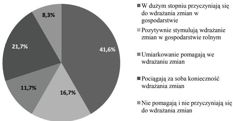
Rys. 2. Opinie rolników na temat wpływu środków pomocowych z PROW 2007-2013 na zmiany w zarządzaniu gospodarstwem

Większość rolników, których zapytano o wpływ środków pomocowych dostępnych w ramach PROW 2007-2013 na wprowadzenie zmian w gospodarstwie, przyznała że pozytywnie stymulują one proces adaptacji innowacji. W badanej próbie 60 rolników, aż 35 z nich uznało, że środki te w dużym stopniu przyczyniają się do wdrażania zmian, bądź też pozytywnie stymulują podejmowanie takich decyzji (rys. 2).