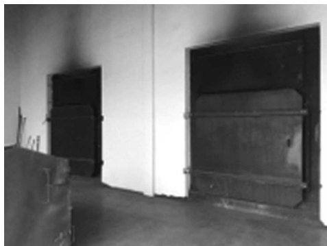
Fotografia 1. Włazy kotła, którymi dostarczane są bele słomy