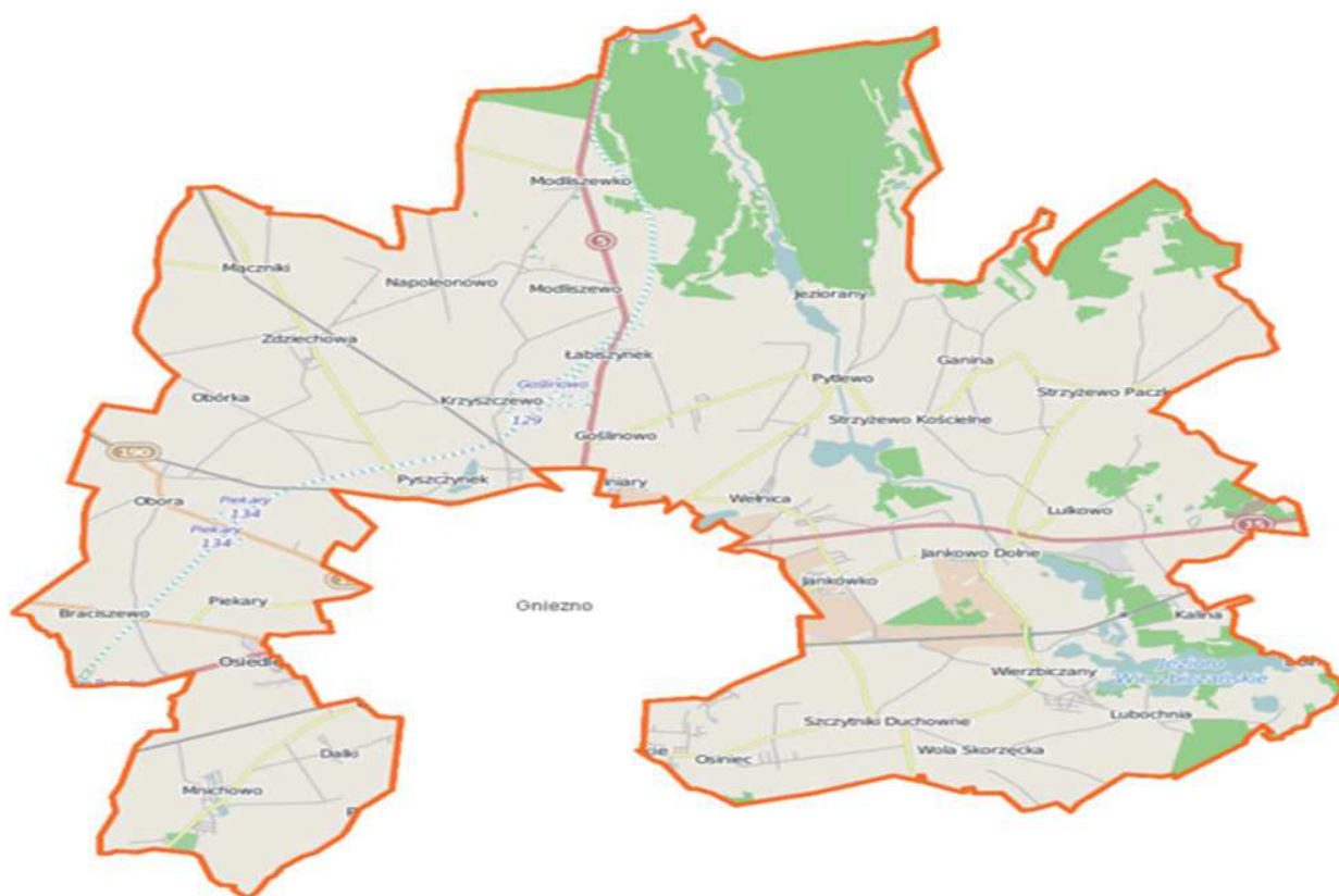
Rysunek 1. Mapa gminy Gniezno

Historia gminy Gniezno jest bardzo bogata. Pojezierze Gnieźnieńskie to jeden z najpiękniejszych zakątków w gminie. W obrębie Pagórków Gnieźnieńskich ma interesującą rzeźbę terenu urozmaiconą doliną Wełny i stokami Wysoczyzny Gnieźnieńskiej. Przez kilka wsi zlokalizowanych w obrębie gminy Gniezno przebiega wielkopolski odcinek szlaku św. Jakuba – jednego z największych szlaków kulturowych w Europie i jednego z najważniejszych chrześcijańskich szlaków pielgrzymkowych. Przez poszczególne miejscowości gminy Gniezno przebiega Szlak Piastowski, który jest jednym z najbardziej rozpoznawalnych i najczęściej przemierzanych szlaków turystycznych w Polsce. Na terenie gminy występują także liczne walory przyrodnicze, m.in.: malowniczo położone jeziora, które stanowią interesujący element krajobrazu.