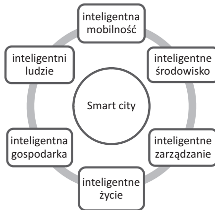
Rysunek 1. Komponenty identyfikacji miast inteligentnych

Centrum Nauk Badawczych w Wiedniu opracowało sześć wyznaczników (inaczej nazywanych podsystemami), za pomocą których można zidentyfikować miasta inteligentne (rys. 1), które są spójne z innymi schematami pomagającymi lepiej zrozumieć inicjatywę smart city – jak na przykład schemat wskazany przez Chourabi i in. 9 , Sikorę-Fernandez 10 , Greco i Bencardino 11 oraz Noori i in. 12